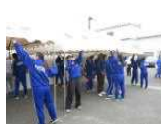
テントの後片付けの様子