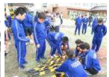
用具の後片付けの様子