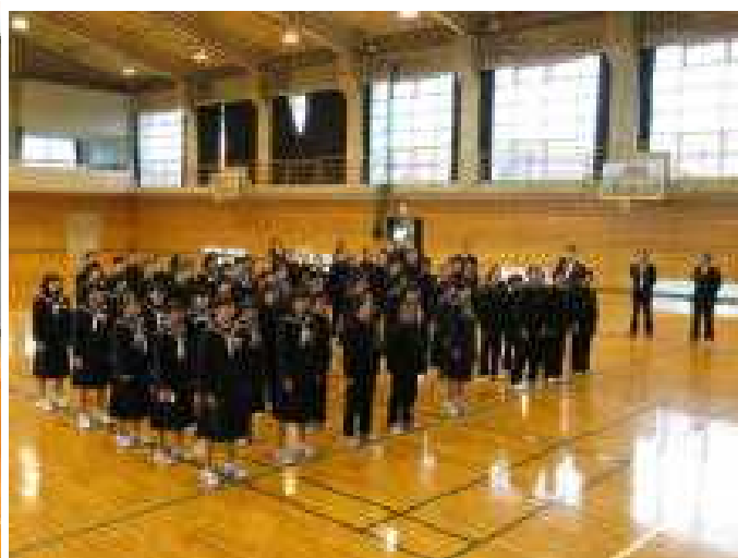
始業式で校歌を歌っている2・3年生の様子