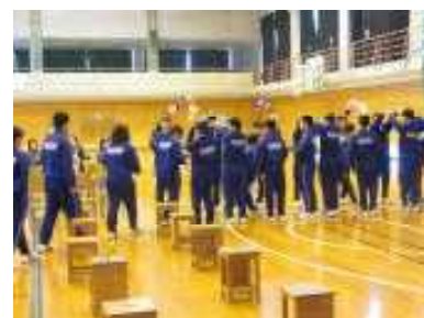
花道を作って3年生退場