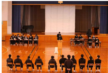
生徒総会のようす

その後、新生徒会役員と委員長の委任式を行い、バトンタッチしました。新たな畑野中学校生徒会の歴史を作り上げてください。